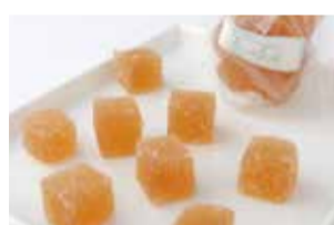
桃の旨みをぎゅっと閉じ込めた「北限の桃ハードゼリー」